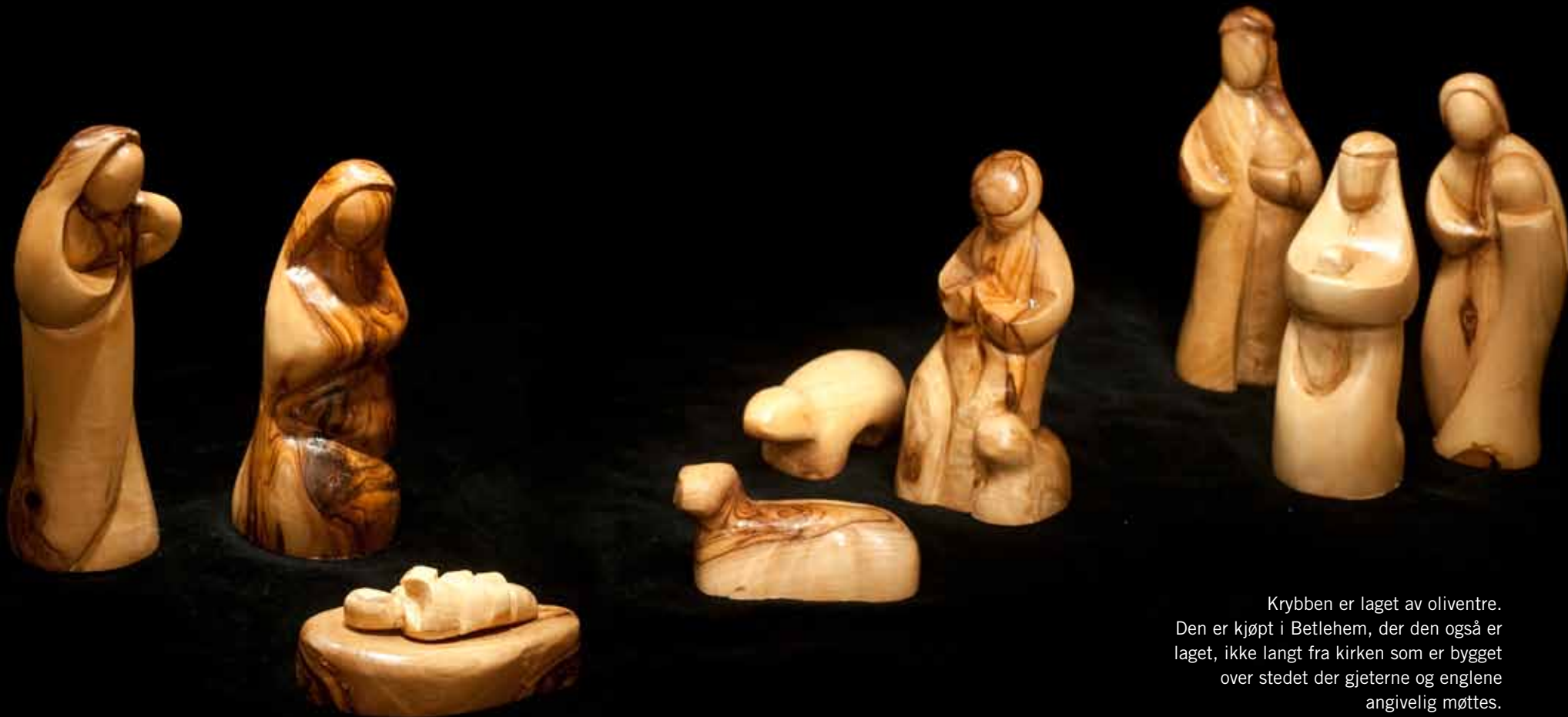
Krybben er laget av oliventre. Den er kjøpt i Betlehem, der den også er laget, ikke langt fra kirken som er bygget over stedet der gjeterne og englene angivelig møttes.