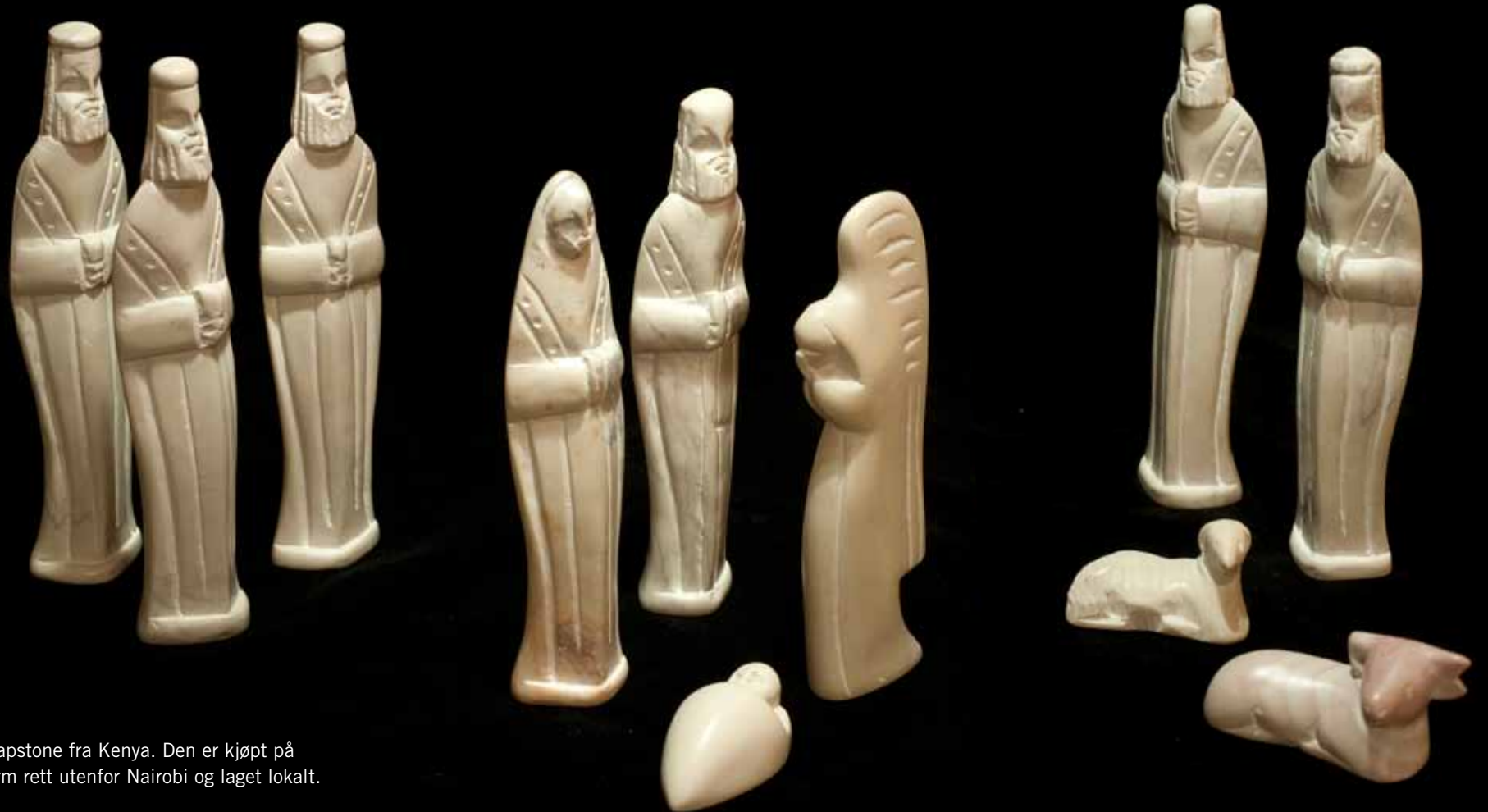
Krybben er av soapstone fra Kenya. Den er kjøpt på Karen Blixens farm rett utenfor Nairobi og laget lokalt.