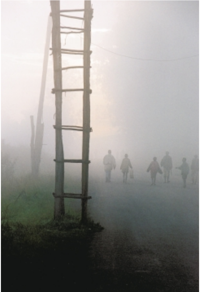
Motiv fra Burundi.