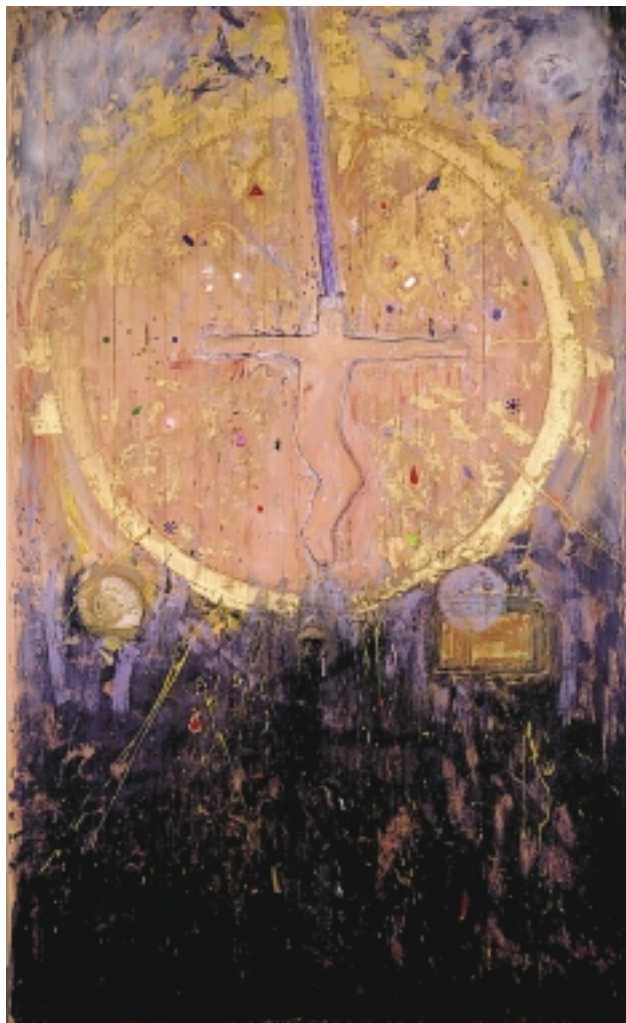
Altartavle fra gravkapellet på Diakonhjemmet. Billedhugger Gunnar Torvund.