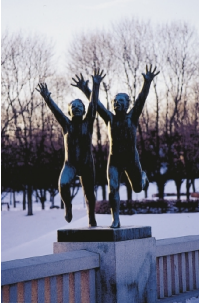
Motiv fra Vigelandsparken.