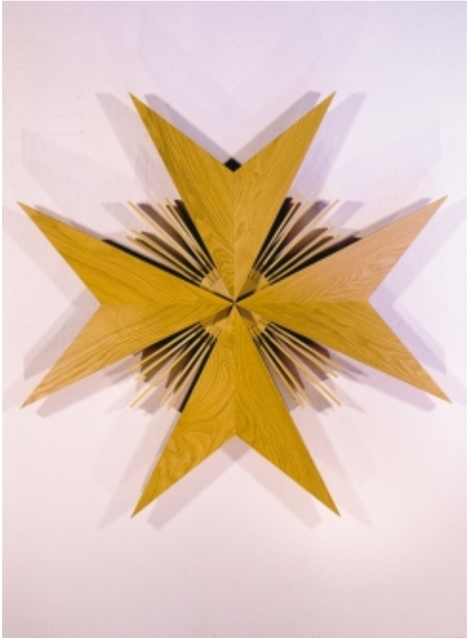
Maltserkorset fra resepsjonen på Diakonhjemmets Sykehus.