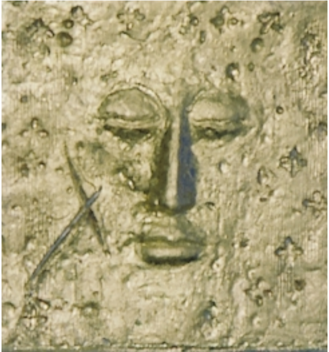
Kristusbilde fra alterpartiet i kapellet på Diakonhjemmet. Billedhugger Gunnar Torvund.