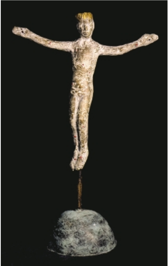
Kristusfigur fra alterpartiet på Diakonhjemmet. Billedhugger Gunnar Torvund.