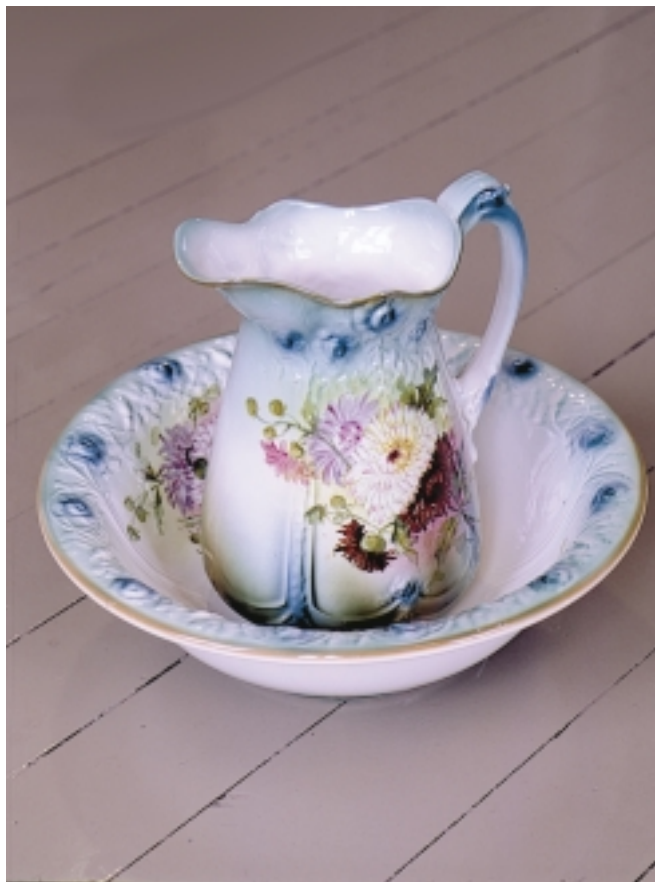
Mugge og vaskefat, fra museet, Diakonissehuset Lovisenberg.